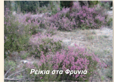
Ρείκια στα Φρουνιά

✓ Σύμφωνα με την απογραφή του 2011 από την Ελληνική Στατιστική Αρχή (ΕΛΣΤΑΤ) ο μόνιμος πληθυσμός της Λευκάδας είναι: Δ. Λευκάδας 22.652, Δ. Μεγανησίου 1.041, Σύνολο 23.693 , ενώ οι μόνιμοι κάτοικοι του χωριού μας είναι 724 και κατά οικισμό: Αλέξανδρος 22, Κολυβάτα 6 και Νικιάνα 724 . Άντε και να χιλιάσουμε!!!