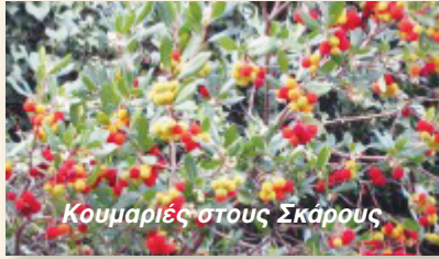
Κουμαριές στους Σκάρους

✓ Επανερχόμαστε τώρα που νομίζουμε ότι είναι η κατάλληλη εποχή για το κλάδεμα των δέντρων στις πλατείες Κολυβάτων και Αλέξανδρου και του Περναριού στην Παναγία και όποιων άλλων δέντρων ανήκουν σε κοινοτικούς χώρους.